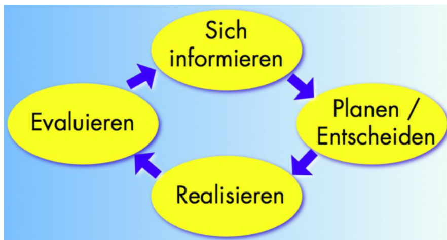
Abbildung 2: Vier Schritte des vollständigen Handlungszyklus'