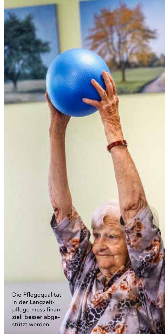
Die Pflegequalität in der Langzeitpflege muss finanziell besser abgestützt werden.

kassen zurückgewiesen und auch von den Kantonen nicht übernommen werden, mit zum Teil lebensbedrohlichen Einkommenseinbußen konfrontiert. Besonders betroffen sind freiberufliche Pflegefachpersonen auf Fachgebieten mit hohem Materialbedarf wie WundexpertInnen.