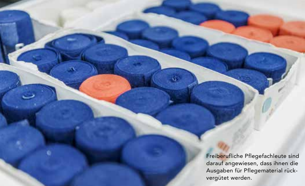
Freiberufliche Pflegefachleute sind darauf angewiesen, dass ihnen die Ausgaben für Pflegematerial rückvergütet werden.

die das Bundesamt für Gesundheit (BAG) einsetzte, um den Stand der Umsetzung der Neuordnung der Pflegefinanzierung (NPF) von 2011 sowie die Zielerreichung und die Nebeneffekte zu evaluieren. Der SBK bedauert, dass im BAG-Schlussbericht vom Januar 2018 keine Daten zu Veränderungen in der Versorgungsqualität geprüft und analysiert wurden, sondern lediglich die finanziellen und strukturellen Auswirkungen. Das Vorhaben, die Beiträge der Krankenkassen an ambulante Pflegeleistungen um 3,6 Prozent zu senken, kritisierte der SBK aufs Schärfste.