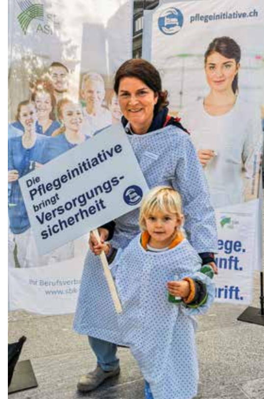
Soll die Versorgungssicherheit auch für künftige Generationen gewährleistet sein, braucht es jetzt konkrete Massnahmen.

Quelle ne fut pas sa déception lorsque l'ASI a appris le 9 mars que le Conseil fédéral rejetait l'initiative sur les soins infirmiers sans contre-projet. Celui-ci annonçait par contre qu'en collaboration avec les acteurs concernés, il examinerait et développerait un plan de mesures pour désamorcer les problèmes dans les soins. Dans une volonté constructive, l'ASI et le comité d'initiative ont d'abord accepté de participer à son élaboration. Huit mois plus tard, le 7 novembre, jour de l'action «Chemise d'hôpital», le Conseil fédéral publiait son message confir-