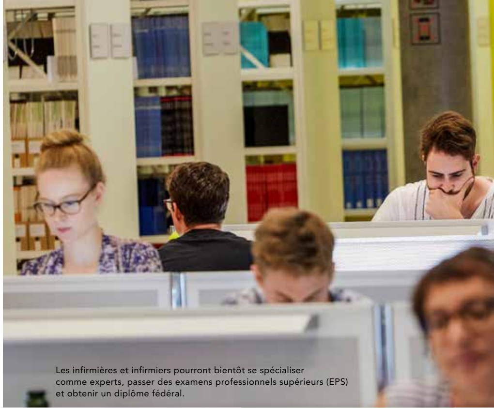
Les infirmières et infirmiers pourront bientôt se spécialiser comme experts, passer des examens professionnels supérieurs (EPS) et obtenir un diplôme fédéral.

Der nachträgliche Titelerwerb (NTE) beschäftigte den SBK auch 2018, denn das Bundesverwaltungsgericht