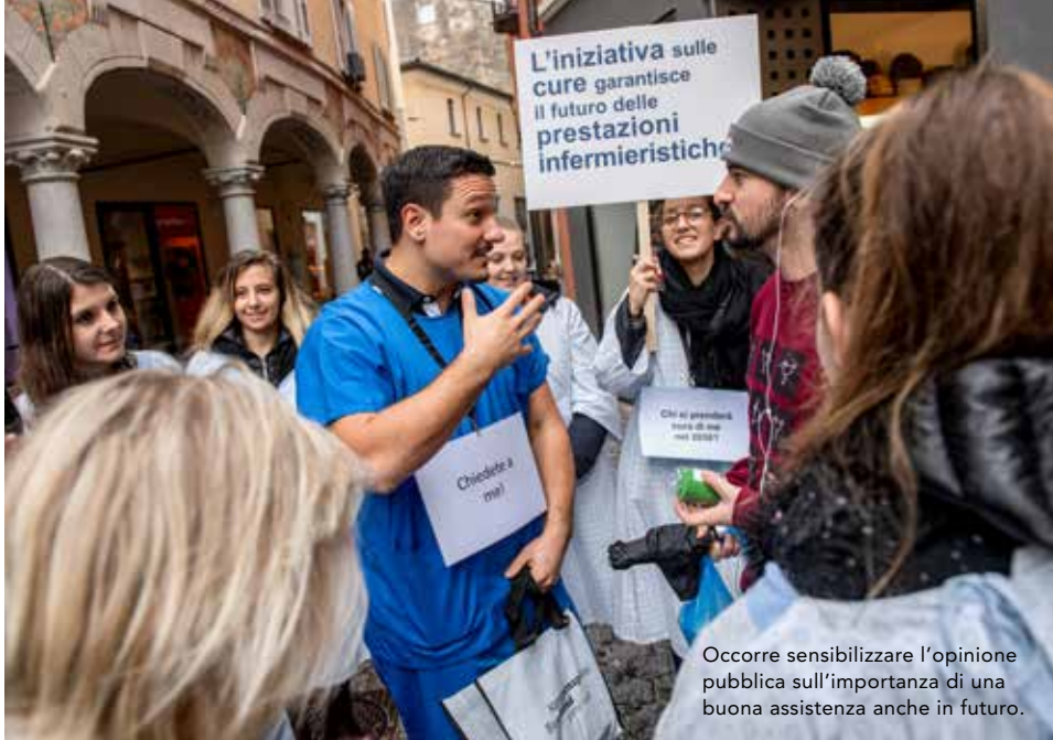
Occorre sensibilizzare l'opinione pubblica sull'importanza di una buona assistenza anche in futuro.

Freiwilligen in den Städten Basel, Bellinzona, Bern, Lausanne, Neuchâtel, Sion, St. Gallen (Foto rechts) und Zürich die «Spitalhemden-Aktion» durch. Mit der Frage «Wer pflegt mich im Jahr 2030?» wurde die Öffentlichkeit für den akuten Mangel an Pflegefachpersonen sensibilisiert. Das Medienecho war enorm. PolitikerInnen unterschiedlichster Parteien signalisierten daraufhin, dass sie sich in der parlamentarischen Debatte für die Anliegen der Pflege starkmachen werden. Insbesondere müssen Pflegefachpersonen als zentraler Bestandteil der Gesundheitsversorgung anerkannt und gefördert und die Eigenständigkeit des Pflegeberufs gesetzlich garantiert werden.