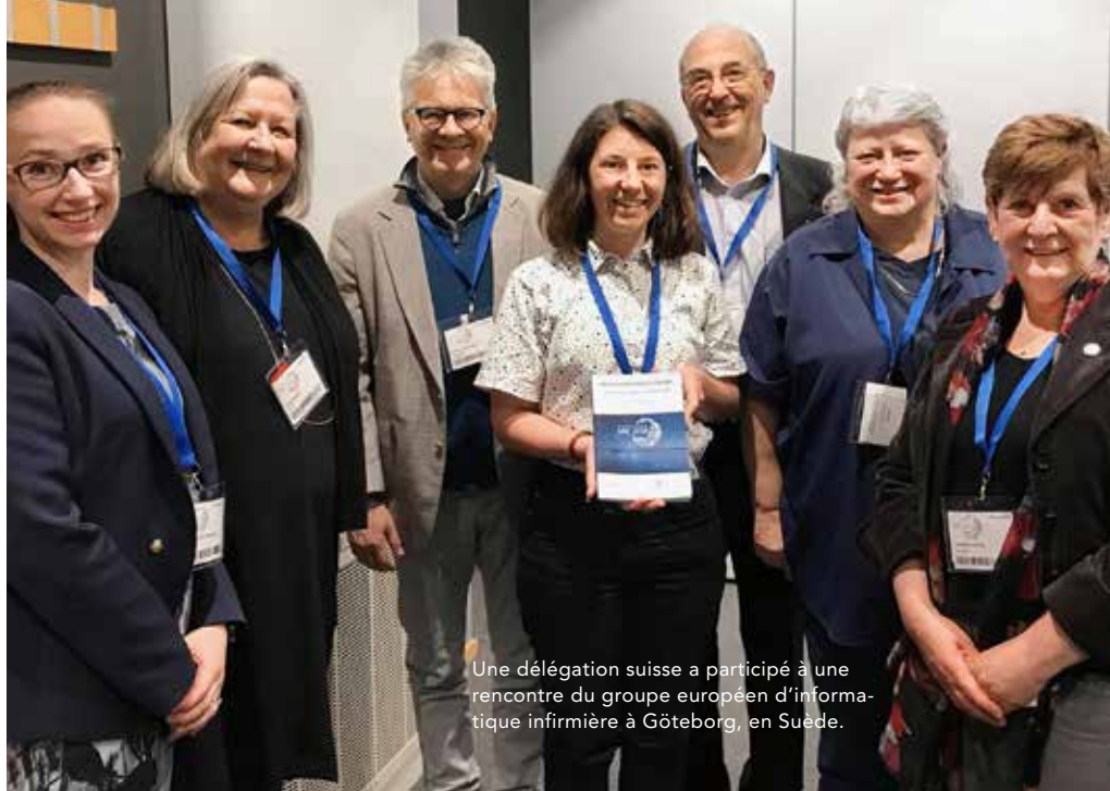
Une délégation suisse a participé à une rencontre du groupe européen d'informatique infirmière à Göteborg, en Suède.

schiedenen Organisationen aus dem Gesundheitsbereich wie Allianz Gesundheit Schweiz, Public Health Schweiz, Plattform Interprofessionalität oder dem Verband der Berufsorganisationen im Gesundheitswesen (SVBG). Wichtig ist diese Vernetzung, um die Anliegen der Pflegefachleute auf verschiedenen Plattformen zu positionieren und in die pflegerelevanten Entscheidungen der verschiedenen fachlichen und politischen Gremien einfließen zu lassen.