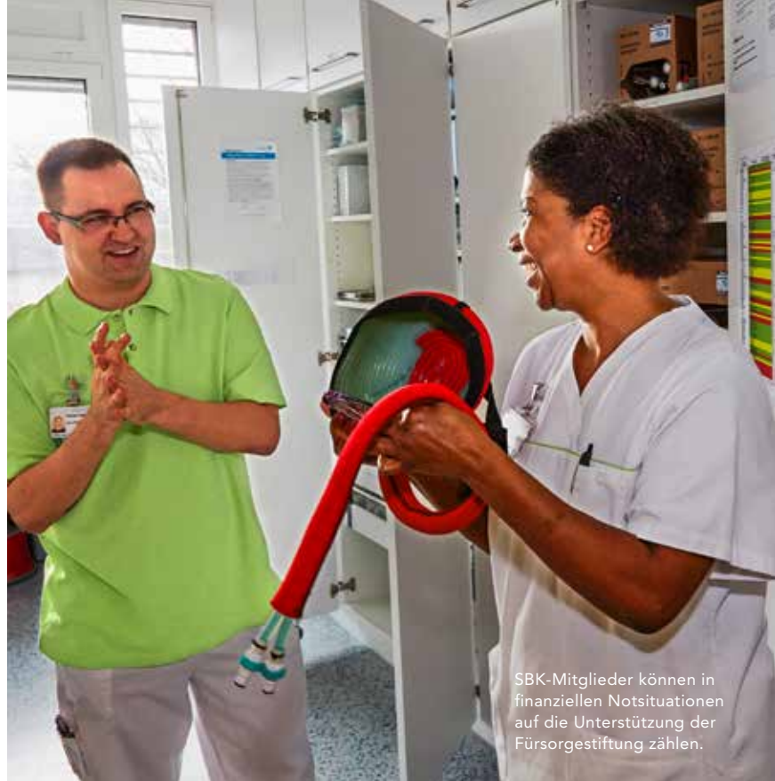
SBK-Mitglieder können in finanziellen Notsituationen auf die Unterstützung der Fürsorgestiftung zählen.

Nursing Students (SNS), wählte 2018 mit Unterstützung des SBK einen neuen Vorstand, der alle Landesteile der Schweiz vertritt. SNS will den Pflegestudierenden in der Schweiz innerhalb des SBK ein ansprechendes Zuhause geben, sie in die Arbeit des SBK involvieren, ihre Vernetzung fördern und ihnen attraktive Dienstleistungen anbieten.