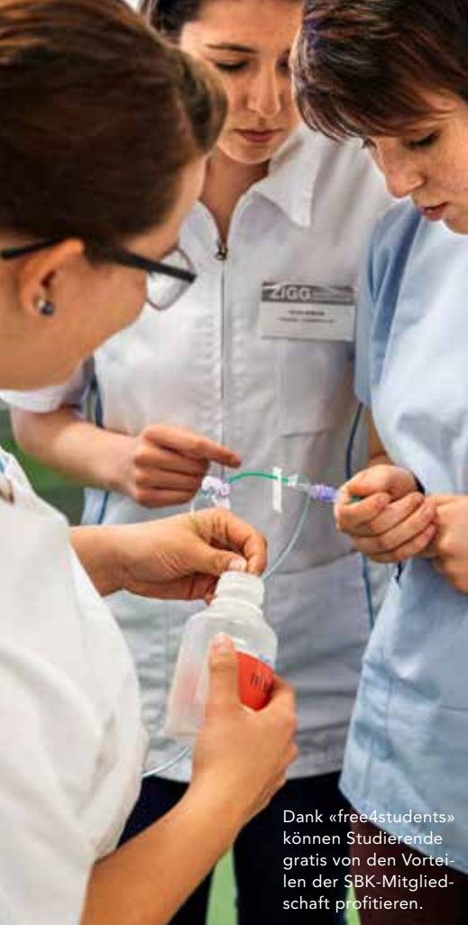
Dank «free4students» können Studierende gratis von den Vorteilen der SBK-Mitgliedschaft profitieren.

sonen massgeblich zur Pflegesicherheit beitragen: Dank ihnen sinkt die Sterblichkeit der PatientInnen, können Komplikationen vermieden und Kosten gespart werden. Gemäss dem Kongress-Motto «Let's get loud!» ermutigte Nationalrätin Barbara Gysi die Kongress-TeilnehmerInnen, ihre Bescheidenheit abzulegen und laut zu werden – ein Aufruf, den es unbedingt und mindestens bis zu den nationalen Wahlen zu befolgen gilt.