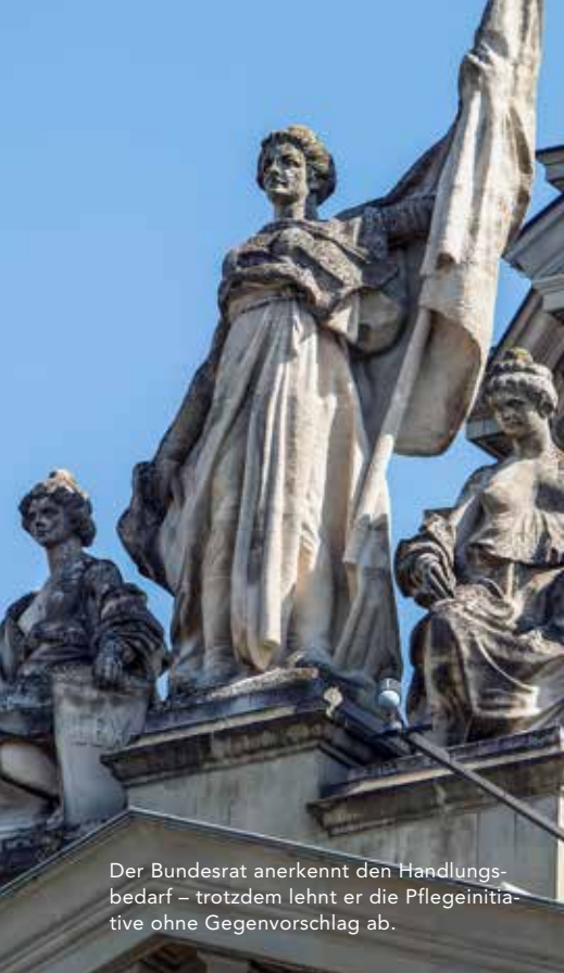
Der Bundesrat anerkennt den Handlungsbedarf – trotzdem lehnt er die Pflegeinitiative ohne Gegenvorschlag ab.

dass er keine zusätzliche Finanzierung der Massnahmen genehmigen werde und nach wie vor an der Ablehnung der Pflegeinitiative festhalte. Der SBK konnte diese Haltung nicht nachvollziehen und beschloss, die Mitarbeit beim Massnahmenplan im Januar 2019 zu beenden. Daraufhin stieg auch die Ärztevereinigung FMH aus dem Massnahmenplan aus. Der SBK wird sich stattdessen voll und ganz auf die politische Lobbyarbeit konzentrieren. Gelingt es den Parlamentariern nicht, einen guten Gegenvorschlag zu präsentieren, wird das Volk über die Pflegeinitiative abstimmen.