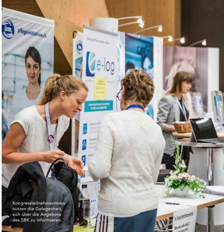
Kongressteilnehmerinnen nutzen die Gelegenheit, sich über die Angebote des SBK zu informieren.

desverwaltungsgericht entschieden hatte, dass die Krankenkassen nicht mehr für die Kosten des Pflegematerials aufzukommen haben (s. auch S. 10). Tarifsuisse nahm dies zum Anlass, den Administrativvertrag vom 1. April 2011 mit dem SBK zu kündigen, was aufwendige Neuverhandlungen zur Folge hatte. Auf Ende Jahr konnte der SBK einen Verlängerungsvertrag aushandeln, der gilt, bis ein definitiver neuer Vertrag besteht. Weiter unterstützte der SBK die Freiberuflichen mit Beratungen sowie in Schlichtungsgesprächen mit den Krankenkassen und beim Aushandeln der Restfinanzierung mit den Kantonen.