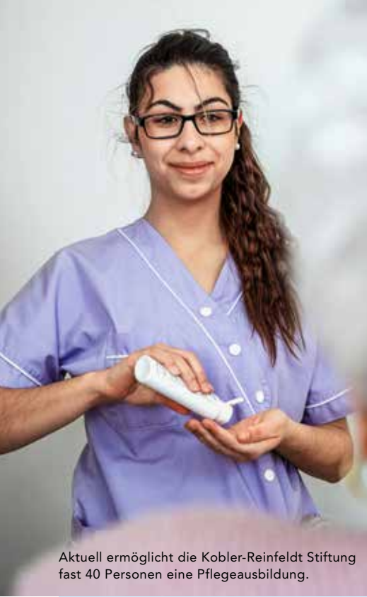
Aktuell ermöglicht die Kobler-Reinfeldt Stiftung fast 40 Personen eine Pflegeausbildung.