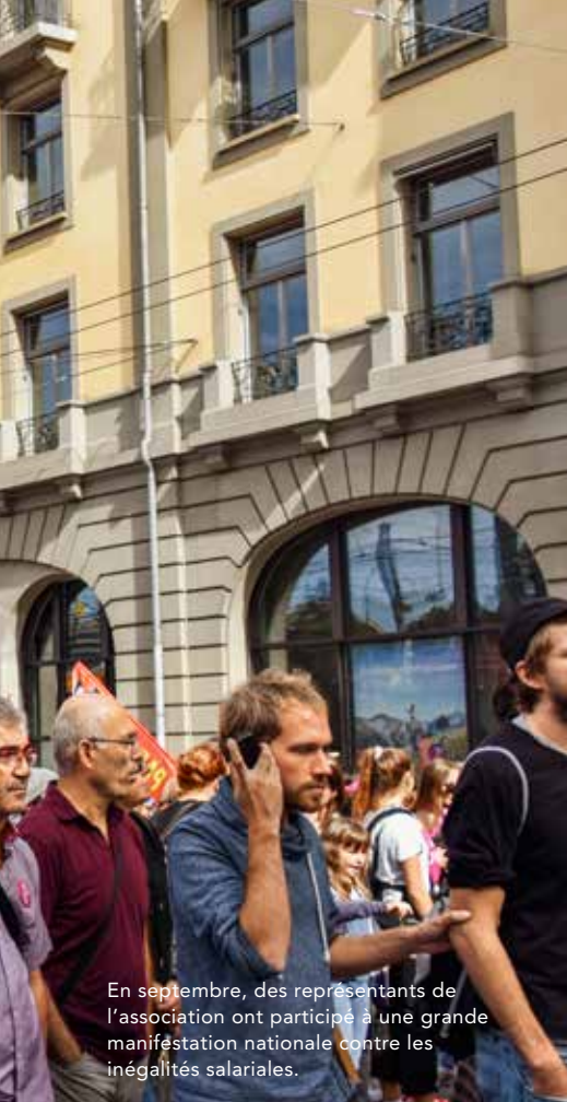
En septembre, des représentants de l'association ont participé à une grande manifestation nationale contre les inégalités salariales.

Berufsverband einmal mehr für die Gleichstellung der Geschlechter stark.