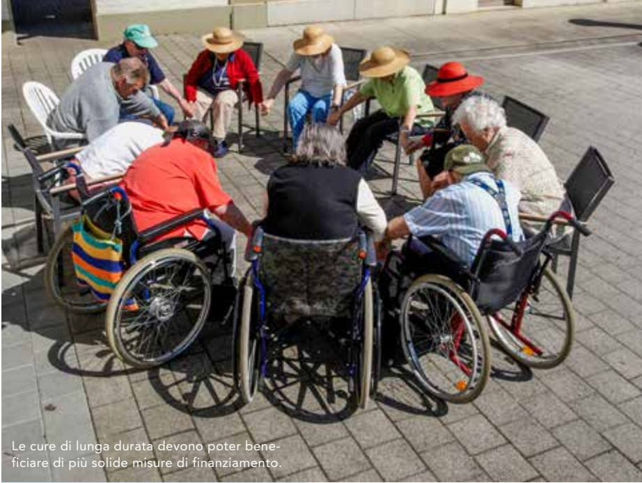
Le cure di lunga durata devono poter beneficiare di più solide misure di finanziamento.