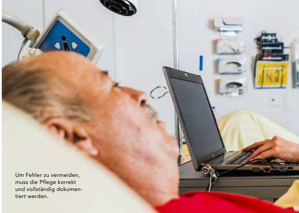
Um Fehler zu vermeiden, muss die Pflege korrekt und vollständig dokumentiert werden.

Die interprofessionelle Vernetzung förderte der SBK durch einen regelmässigen Informations- und Kommunikationsaustausch mit ver-